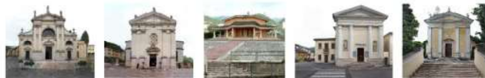
S. Maria Assunta Marostica S. Antonio Abate Marostica Santo Nome di Maria - MarsanVallonara S. Giovanni Battista Pianezze S. Lorenzo Marostica