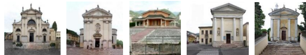
S. Maria Assunta Marostica S. Antonio Abate Marostica Santo Nome di Maria - Marsan S. Giovanni Battista Vallonara S. Lorenzo Pianezze