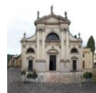
S. Maria Assunta Marostica