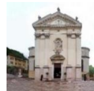
S. Antonio Abate Marostica