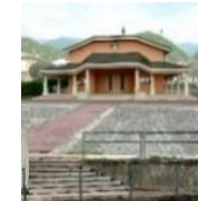
Santo Nome di Maria - Marsan