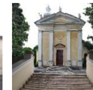
S. Lorenzo Pianezze