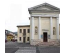
S. Giovanni Battista Vallonara