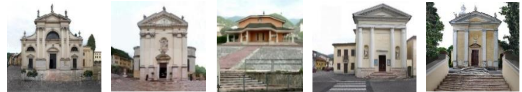
S. Maria Assunta Marostica S. Antonio Abate Marostica Santo Nome di Maria - Marsan S. Giovanni Battista Vallonara S. Lorenzo Pianezze