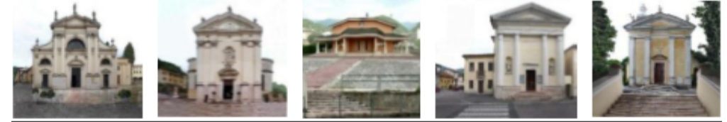
S. Maria Assunta S. Antonio Abate Santo Nome S. Giovanni Battista S. Lorenzo