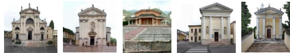
S. Maria Assunta Marostica S. Antonio Abate Marostica Santo Nome di Maria - Marsan S. Giovanni Battista Vallonara S. Lorenzo Pianezze