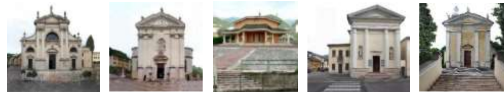
S. Maria Assunta Marostica S. Antonio Abate Marostica Santo Nome di Maria - Marsan S. Giovanni Battista Vallonara S. Lorenzo Pianezze