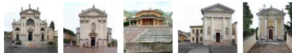
S. Maria Assunta Marostica S. Antonio Abate Marostica Santo Nome di Maria - Marsan S. Giovanni Battista Vallonara S. Lorenzo Pianezze