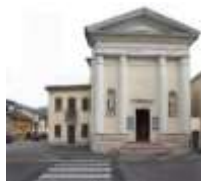
S. Giovanni Battista Vallonara