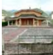
Santo Nome di Maria - Marsan