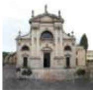
S. Maria Assunta Marostica