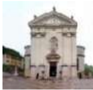
S. Antonio Abate Marostica