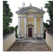
S. Lorenzo Pianezze