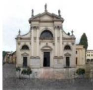
S. Maria Assunta Marostica