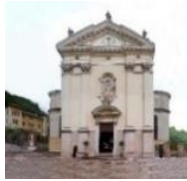
S. Antonio Abate Marostica