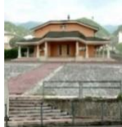
Santo Nome di Maria - Marsan