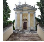
S. Lorenzo Pianezze