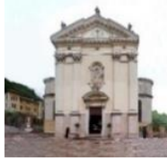
S. Antonio Abate Marostica