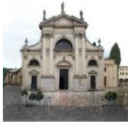
S. Maria Assunta Marostica