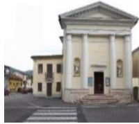
S. Giovanni Battista Vallonara