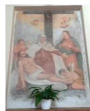
Dipinto della deposizione di Gesù dalla Croce.

Raggiunta la zona collinare di Roveredo Alto si può vedere la chiesa dedicata alla Madonna delle Grazie. Fu edificata nel 1836 dalla gente del luogo come ringraziamento alla Vergine per essere stati preservati dalla peste che aveva imperversato nelle zone circostanti. Sorge a filo della strada che da Marostica sale a San Luca. La struttura muraria è caratterizzata da particolari costruttivi tipici del Medioevo.