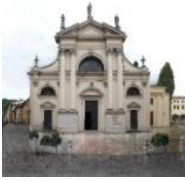
S. Maria Assunta Marostica