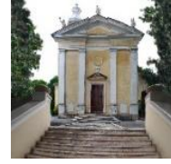
S. Lorenzo Pianezze