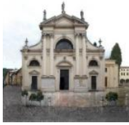
S. Maria Assunta Marostica