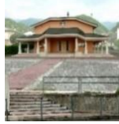
Santo Nome di Maria - Marsan