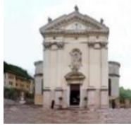
S. Antonio Abate Marostica