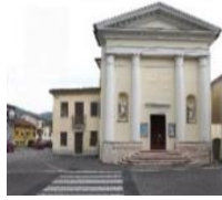
S. Giovanni Battista Vallonara