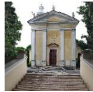
S. Lorenzo Pianezze