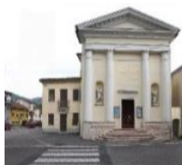
S. Giovanni Battista Vallonara