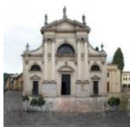
S. Maria Assunta Marostica