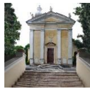
S. Lorenzo Pianezze