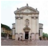
S. Antonio Abate Marostica