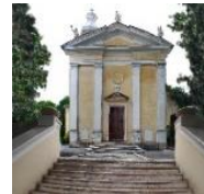
S. Lorenzo Pianezze