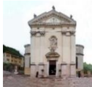
S. Antonio Abate Marostica