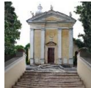
S. Lorenzo Pianezze