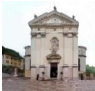
S. Antonio Abate Marostica