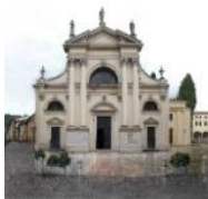
S. Maria Assunta Marostica