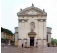
S. Antonio Abate Marostica