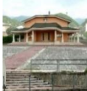
Santo Nome di Maria - Marsan