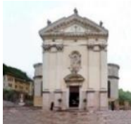
S. Antonio Abate Marostica