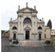
S. Maria Assunta Marostica