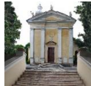
S. Lorenzo Pianezze