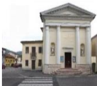
S. Giovanni Battista Vallonara