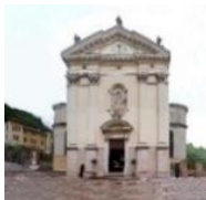
S. Antonio Abate Marostica