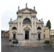
S. Maria Assunta Marostica