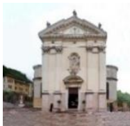
S. Antonio Abate Marostica