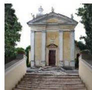
S. Lorenzo Pianezze