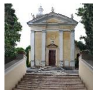
S. Lorenzo Pianezze